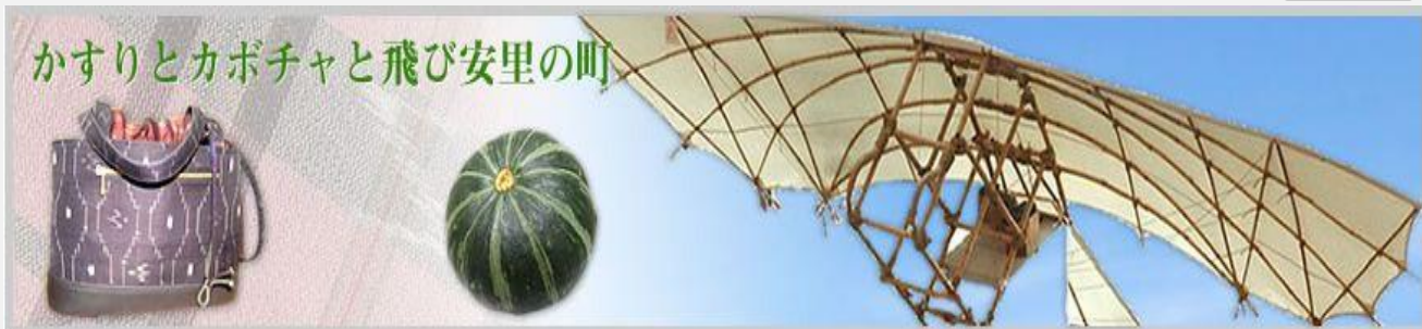
かすりとカボチャと飛び安里の町