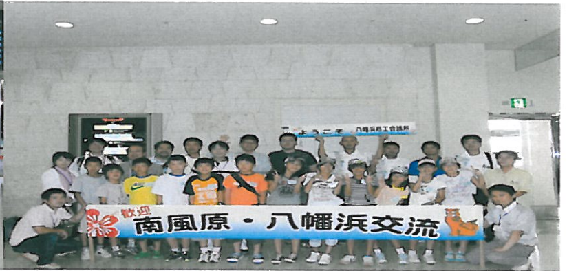
八幡浜市児童並びに引率者