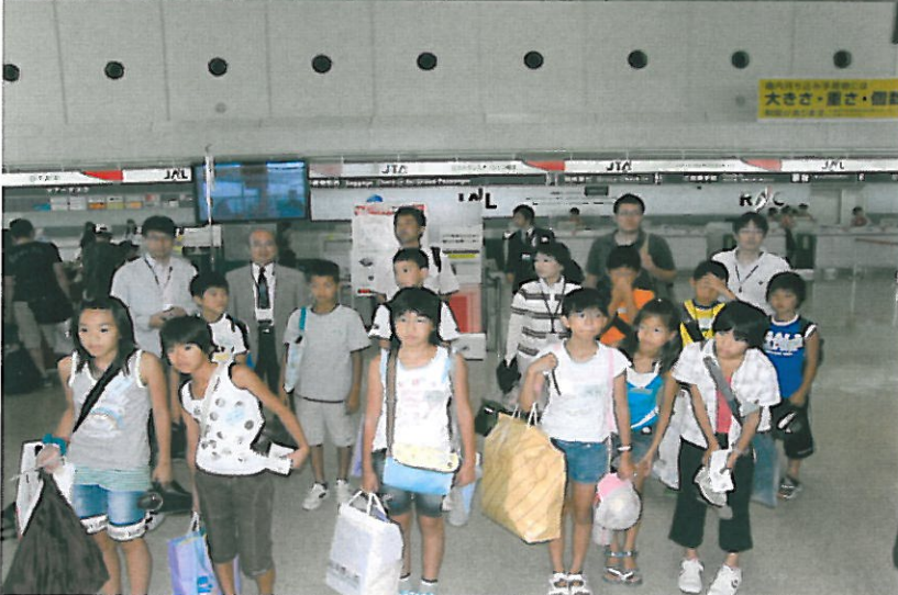
御礼を述べる 八幡浜市児童等 (那覇空港3階ロビー)