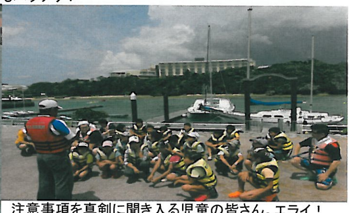
注意事項を真剣に聞き入る児童の皆さん。エライ！