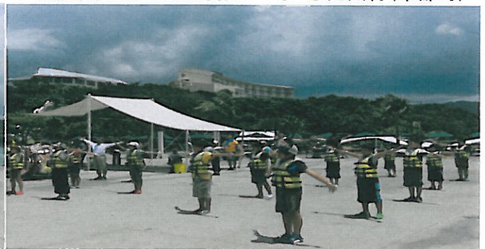
準備体操は十分に！！