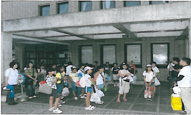
出発式(大城部長より諸注意等事務連絡)

いざ、本部町へ。美ら海水族館見学並びにもとぶ元気村にてマリンスポーツ体験を行う。 照りつける太陽の暑さも何の！ 児童のパワーが圧倒！！