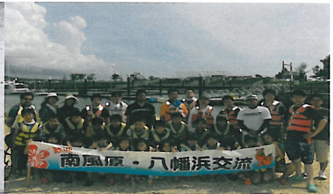
体験学習 がんばるぞお～：もとぶ元気村(本部町)