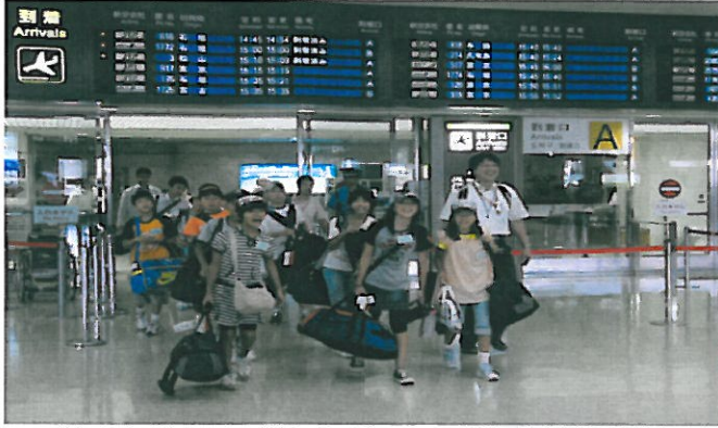
着いたどお～楽しむぞお～（那覇空港到着）

ほぼ定刻どおり那覇空港到着。最高の笑顔で沖縄入り。 体調には留意して、楽しい思い出作りを。