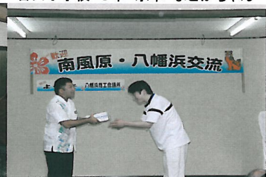
平岡青年部会長より大城部長へお土産贈呈