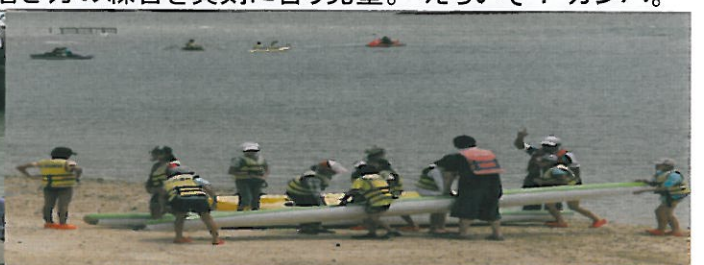
チーム連携もバッチリ！