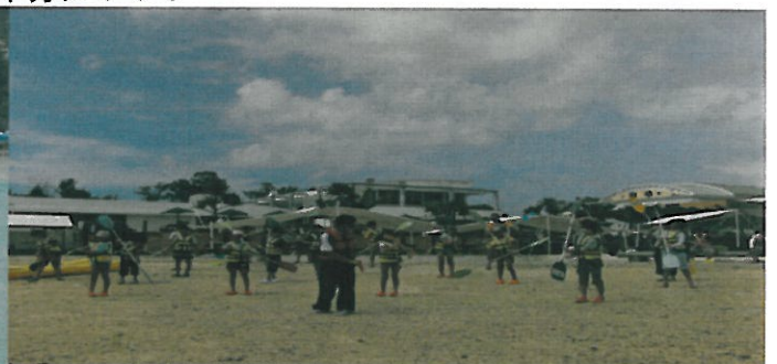
漕ぎ方の練習を真剣に習う児童。えらいぞ！ガンバ。