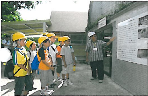
南風原町防空壕体験