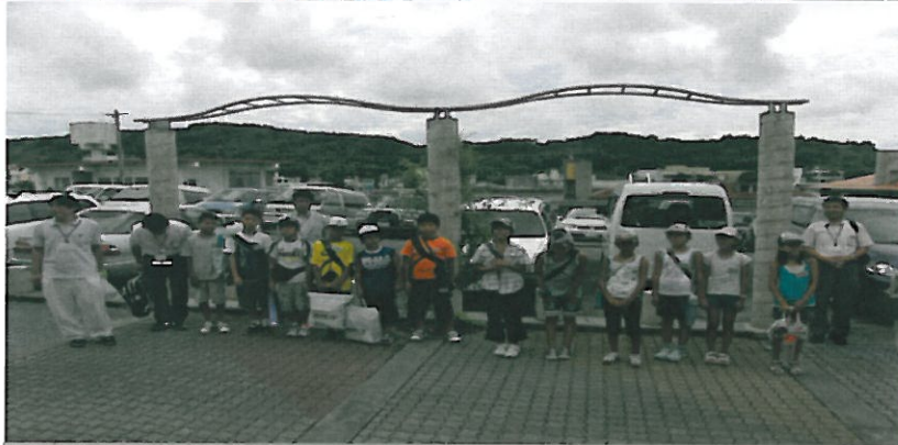
御礼を述べる 八幡浜市児童等 (本商工会館前にて)