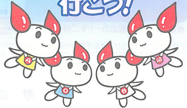
献血キャラクター