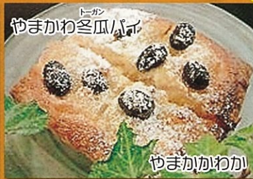
トコタン やまがかわ冬瓜パイ