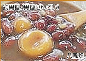
純黒糖(黒糖ぜんざい)