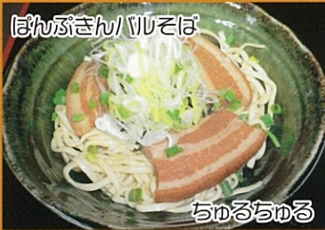
ぼんぶきん/ソそば