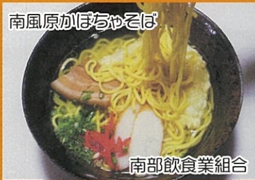
南風原かぼちゃそば