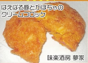
はえはる豚とかぼちゃの クリームコロッケ