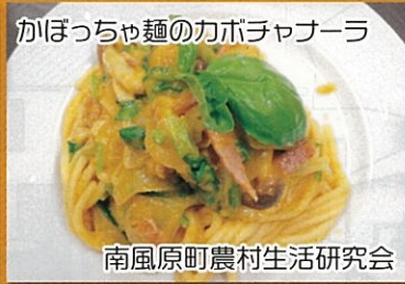
かぼちゃ麺のカボチャソーラ