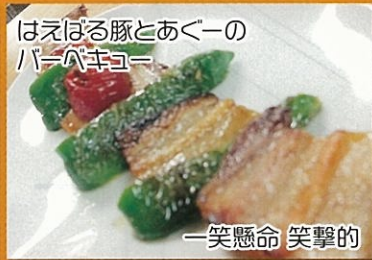
はえはる豚とあくーの パーバキュー