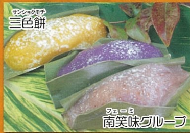
サンショクモチ 三色餅