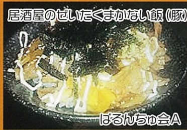
居酒屋のせいにくまかない飯(豚)