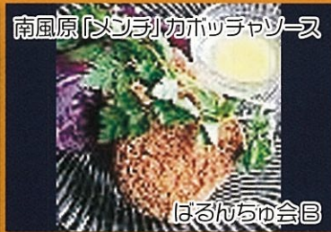
南風原「メンリ」カボチャソーヌ