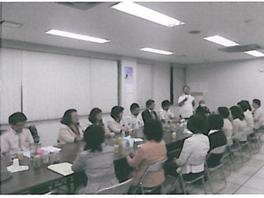
【有意義ななか懇親会が開かれた】