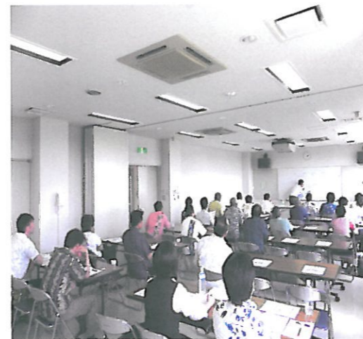
【広域連携講習会（南風原町商工会）】