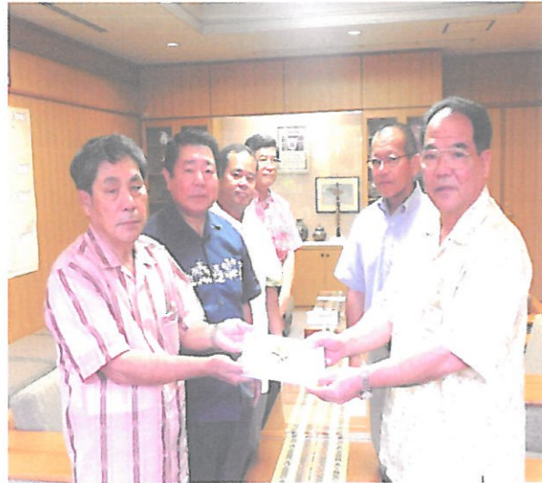
【義援金を城間町長（写真右）へ託す赤嶺商工会会長（写真左）】