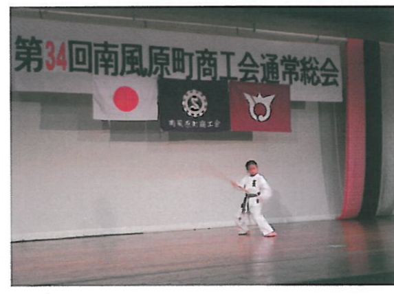
【余興：南風原町ちびっ子空手演舞会（ちびっ子空手）】