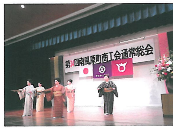
【余興：幕開け かぎやで風（商工会女性部員の皆さん）】